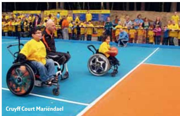
Cruyff Court Mariendaël