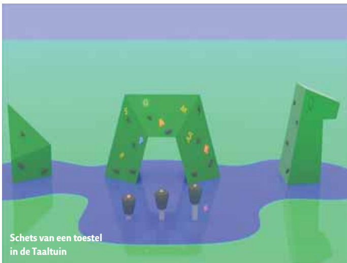
Schets van een toestel in de Taaltuin