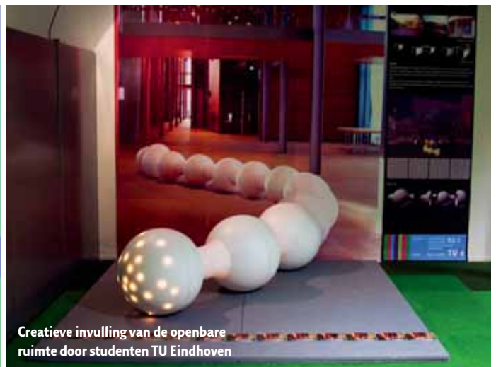
Creative invulling van de openbare ruimte door studenten TU Eindhoven

Het begrip homo ludens (letterlijk ‘spelende mens’) is door cultuurwetenschapper Johan Huizinga geïntroduceerd om het belang van spel te benadrukken.