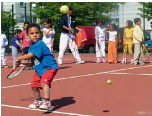
De Richard Krajicek Foundation stimuleert actief bezig zijn.